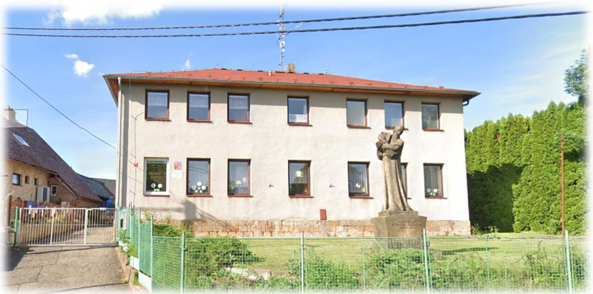
Místo poskytovaného vzdělávání Verdek 72