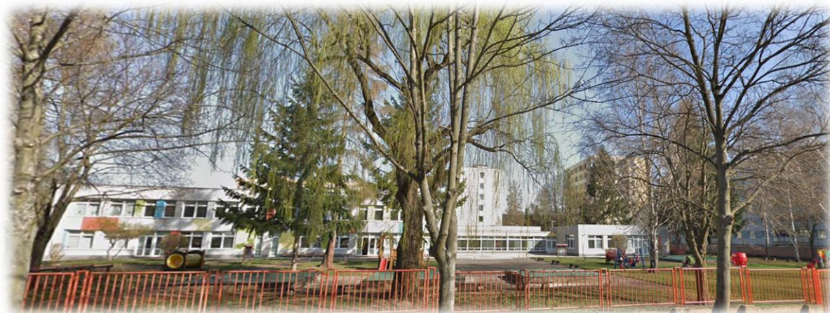
Místo poskytnutého vzdělávání Elišky Krásnohorské 2428

Školní zahrady jsou v původním stavu, což je jedna z kapitol revitalizace a možnosti obnovy zahrad pro děti tak, aby vyhovovaly současným standardům a byly pro děti maximálně využitelné a bezpečné. Stávající prvky jsou každým rokem opravovány a jejich životnost tím dočasně prodlužována. Děti mají na všech zahradách možnost využívat nerezové pítka pro zajištění komfortu pitného režimu v době pobytu venku. Dalším přínosem by byla také rekonstrukce venkovních sociálních zařízení pro děti pro pobyt na školní zahradě.