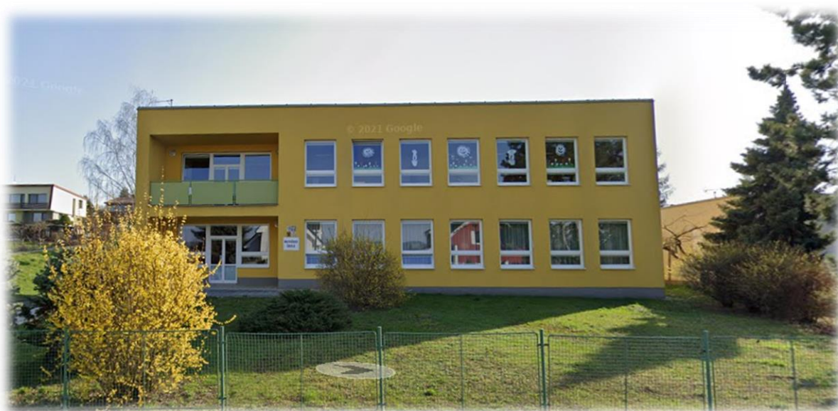
Místo poskytnutého vzdělávání Slunečná 2792